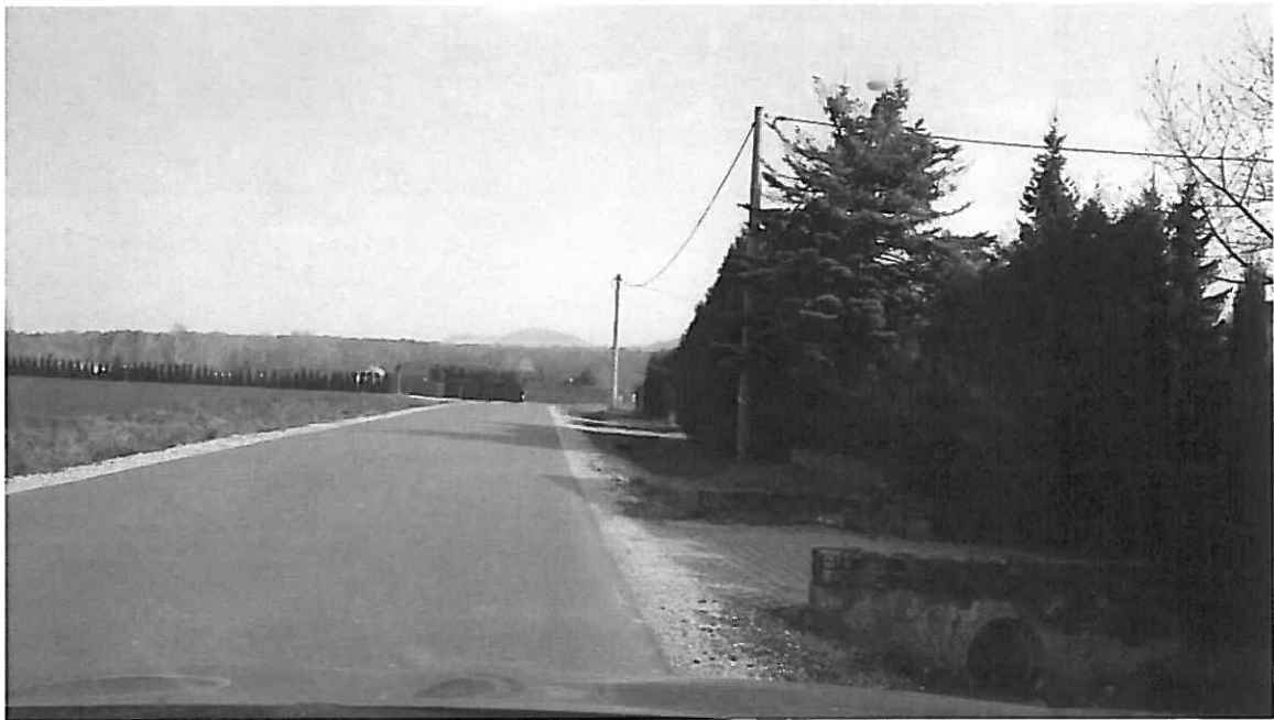
2. Rejon skrzyżowania ul. Górską / ul. Janowicka